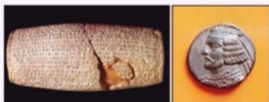
منشور کوروش - موره بریتانیا در لندن

۱ تصاویر زیر را به دقت نگاه کنید و بگویید چرا هر یک از آنها، منبع دست اول برای دوره خود هستند.