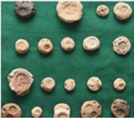
تعدادی از ۷۳ گلمهره متعلق به دوران ساسانیان که با پیگیری حقوقی دولت در سال ۱۳۹۴ به کشور بازگشت.

به تصویر زیر دقت کنید و بگویید چرا بازگرداندن اشیای تاریخی به کشور اقدامی مهم و ارزشمند است؟